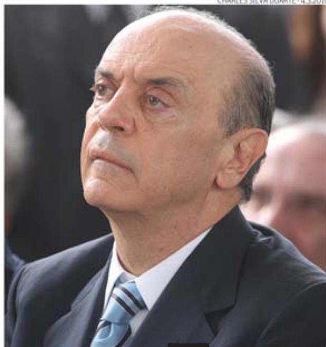
Tucano é recebido aos gritos de "Brasil pra frente, Serra presidente"

São Paulo. Os dois adversários na corrida pela Presidência da República, a ministra chefe da Casa Civil, Dilma Rousseff (PT), e o governador de São Paulo, José Serra (PSDB), intensificam a maratona de viagens pelo país.