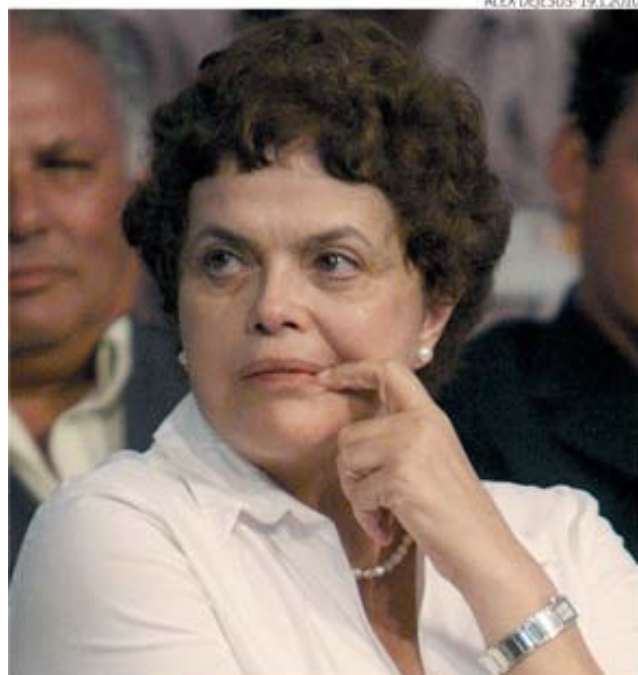
Dilma ouviu Lula cantarolar "Dilminha incomoda muito mais"