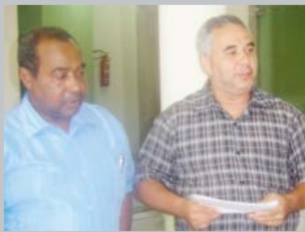
Representantes do CONSEP, estiveram na reunião, tratando de assuntos referentes a liberação de computadores para entidades e esclareceram dúvidas da AMEM.

de atribuições estejamos a frente sendo voluntário, o voluntariado é uma atitude de carinho e amor a vida, ao bem maior, de chegar à esses grupos menos favorecidos para que a gente possa estar ajudando e isso é uma satisfação, o próprio Jesus nos deu esse exemplo de vir não para julgar, mas para salvar, o próprio Jesus veio para servir e não para ser servido, nós temos que criar e exercitar esse hábito de servir.