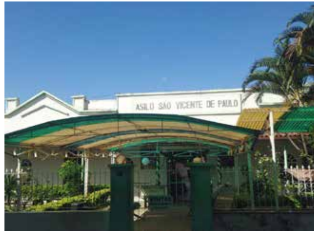
Asilo São Vicente de Paulo

Diversos convênios foram assinados entre entidades e prefeituras da região com órgãos do governo mineiro, por meio da ação do deputado estadual João Magalhães, assegurando recursos para custeio na área de saúde, entre outros benefícios. Em Manhuaçu, foram mais