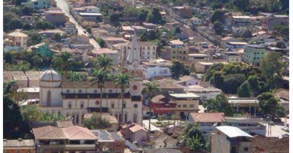
Vereadores de Guarapari aprovam orçamento para 2016.